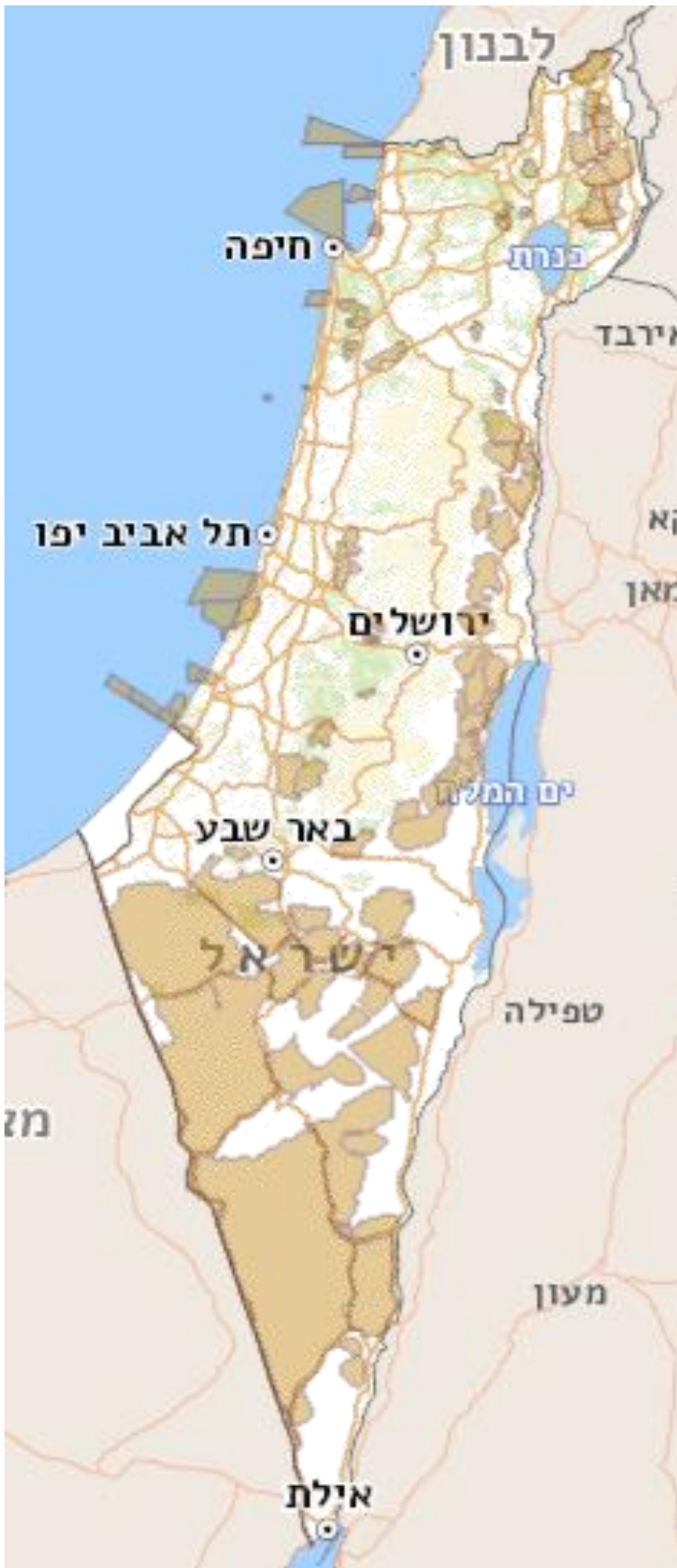
איור 4: השטחים המוחזקים על ידי מערכת הביטחון

גם לאחר שנת 1994 נכתבו שני דוחות שעסקו בנושא זה, דוח 61 א' משנת 2011 "השימוש של צה"ל בקרקעות המדינה, והאחרון שפורסם לקראת סיום כתיבת עבודה זו, דוח 71 ב' שטחי האימונים של צה"ל ביבשה.