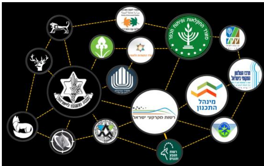
איור 1: מיפוי השחקנים האפשריים

במחקר, שולבו שיטות מגישת העיצוב והמחקר האיכותני. כחלק מגישת העיצוב נשאבו שלב מיפוי השחקנים הרלוונטיים, ניתוח המערכת ההיסטורית של קביעת שטחי האימונים, זיהוי האינטרסים ויחסי הגומלין בין צה"ל לשחקנים הנוספים ואיתור האתגרים העומדים לפתחה של מדינת ישראל בהיבטים הנוגעים לשימוש בשטחים הפתוחים בעשורים הקרובים.