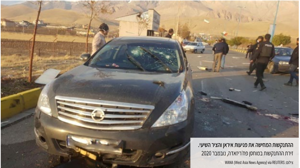
ההתנקשות המחישה את פגיעות איראן והציר השיעי. זירת ההתנקשות במוחסן פח'ריזאדה, נובמבר 2020