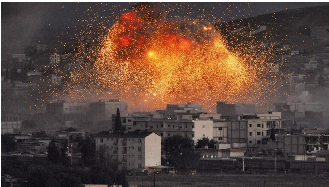
ינואר 2016, הפצצת "הבנק של דאע"ש" במוסול, עיראק

מודיעין מדויק ומתוך החלטה מודעת שבתקיפת המטרות יפגעו גם 'בלתי מעורבים' הנמצאים בסביבת המטרות. שתי דוגמאות אלו הינן אמנם הגדולות שבתקיפות הצבא האמריקאי והינן רק חלק מהמאמץ האמריקאי המתמשך לצמצם ולעקר את יכולות הארגון לתפקד כישות מדינתית. ממשל טראמפ כאמור משמר מדיניות שהחלה בתקופת כהונתו של הנשיא אובמה, אך נראה כי הנשיא החדש מעוניין למנף פעולות אלו גם לצרכים הרתעתיים אזוריים נוספים. לצורך כך למשל, משמשת ההפצצה האמריקאית כנגד תשתית מנהרות של ארגון דאע"ש באפגניסטן. ההפצצה ב-14 באפריל 2017 בה נעשה שימוש בפצצת "מואב" שהינה הפצצה הלא-גרעינית הגדולה בעולם (משקלה המוערך הינו כ-10 טון), מאפשרת לנשיא טראמפ להעביר מסר ברור לארגון ולעולם (רמיזה ברורה לעבר רוסיה) – שינוי האסטרטגייה האמריקאית בטיפול בטרור בכלל וב'מדינה האסלאמית' בפרט.