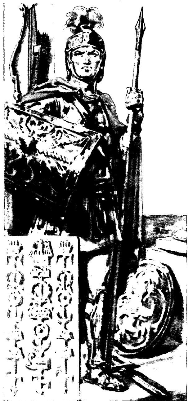
הלגינורים הרומאיים היו מוגנים באופן קיצוני, אך בגלל המשקל הרב של ציוד המגן שלהם בקושי יכלו לרדוף אחרי אויב בורח

לרוב, משום שגם בתקופה פוסט־הרואית זו התפיסה הרווחת של המלחמה בקרב הממסדים הצבאיים היא עדיין נפוליאונית: היא שמה דגש על פעולה התקפית להשגת מטרות מערכתיות. זו, כפי שיוצג להלן, מנטליות המותאמת בצורה גרועה לתנאים הפוסט־הרואיים.