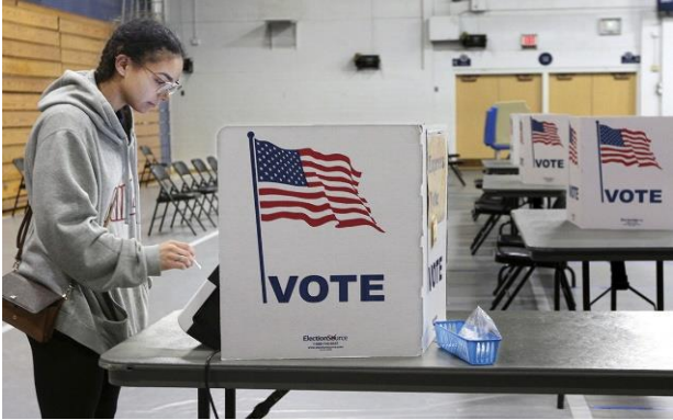
בוחרת מצביעה בוויסקונסין (7)