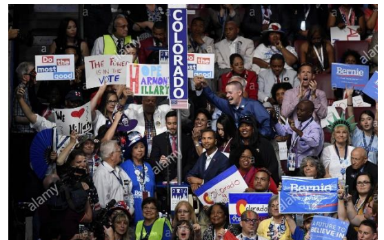
הצירים מטעם קולורדו בוועידה הדמוקרטית (2016)