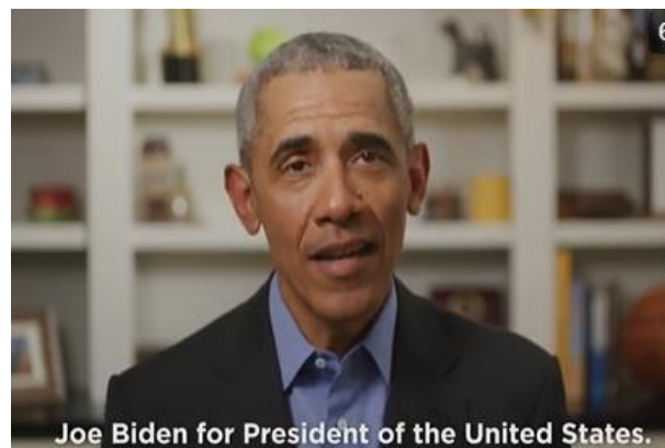
אובמה מודיע על תמיכתו בביידן (8).

המרוץ הדמוקרטי למועמדות המפלגה לנשיאות נגמר למעשה, ובנובמבר יתמודד ג'ו ביידן נגד הנשיא טראמפ. ביידן אמנם ייבחר באופן רשמי רק בוועידה הדמוקרטית באוגוסט, אך פרישתו של סנדרס (8) מבטיחה לסגן הנשיא לשעבר את המועמדות (למרות שהבחירות המקדימות לצירים נמשכות - ראו בהמשך). בניגוד לבחירות 2016, בחר הפעם סנדרס לשדר מסר פייסני ולתמוך במועמדותו של ביידן לנשיאות בשלב מוקדם, המאפשר לביידן את הזמן הדרוש להתכונן לבחירות הכלליות. בנוסף לסנדרס, הכריזו בכירים נוספים, ביניהם הנשיא לשעבר אובמה (שדאג להדגיש כי ביידן הינו המועמד הפרוגרסיבי ביותר בהיסטוריה של המפלגה הדמוקרטית), אליזבת וורן ומרבית המועמדים הדמוקרטיים לשעבר, על תמיכתם במועמדותו של ביידן.