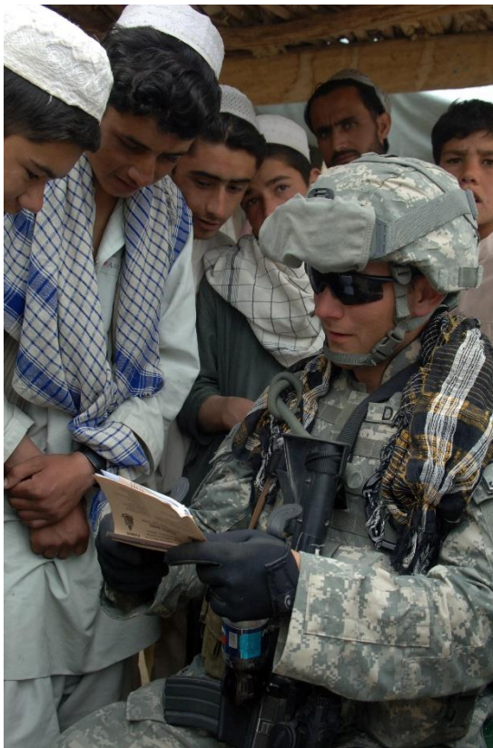
חייל אמריקאי מתשאל תלמידים אפגנים

חוויה מיוחדת הייתה לי לפקד על שורת מג"דים מעולים ולהעמיק יחד ברזי המנהיגות הקרבית. בזכות החיכוך צברנו ניסיון בלמידה מבצעית וטיוב הערכת המצב, התאוששות מכישלונות ופיקוד במצבי איזודאות. בנקודה זו קשה להפריז בערכם העצום של היוזמה ו"פיקוד מטרה" בניהול הקרב. טעיתי לא פעם בהערכת המצב, נתתי פקודות שגויות, ועל אחת כמה וכמה בעת אירועים מתפרצים. רק במקום שבו המג"דים נטלו יוזמה, ניסו להשפיע על המח"ט, הרחיבו משימות ושינו אותן לאור המטרה והבנות בשטח, היינו אפקטיביים יותר.