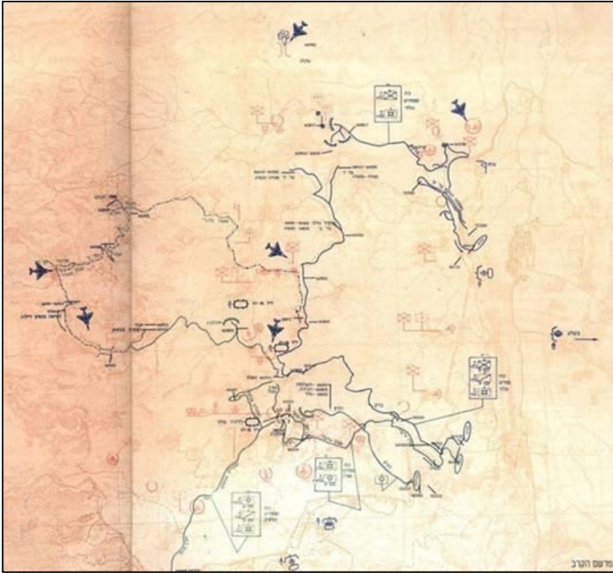
מפה מבצעית של דרום לבנון בזמן מבצע "קלחת 4 מורחבת" (אתר יד לשריון)

בדיון ההמשך להערכת המצב של אג"ם יוחד חלק מרכזי לדיון אודות הפח"ע. אלעזר פתח והצהיר כי לדעתו לא ניתן ולא צריך לכבוש שטח בלבנון כחלק מן המענה לבעיית פת"ח. כיבוש כזה יסבך אותנו עם המערכת הבינלאומית ובעיקר עם ארה"ב, הוא איננו אפשרי, יגרום לסנקציות כנגדנו וייצור נזק רב. 62