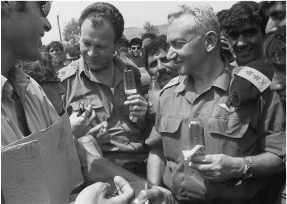
הרמטכ"ל רא"ל חיים בר לב ומפקד פיקוד צפון האלוף מרדכי (מוטה) גור מבקרים את הכוחות לאחר החזרה מלבנון, 14 במאי 1970

לסיכום, אסטרטגיית התשה היא תהליך המכיל בתוכו אפקט מצטבר; המיועד לפגיעה ביכולתו אולם בעיקר (במקרה הישראלי) ברצונו של האויב להילחם; שהצד החלש יכול לנקוט בו, אולם גם הצד החזק שנמנע מלהכניע; ושתוצאותיה פעמים רבות הן מתוננות. 13