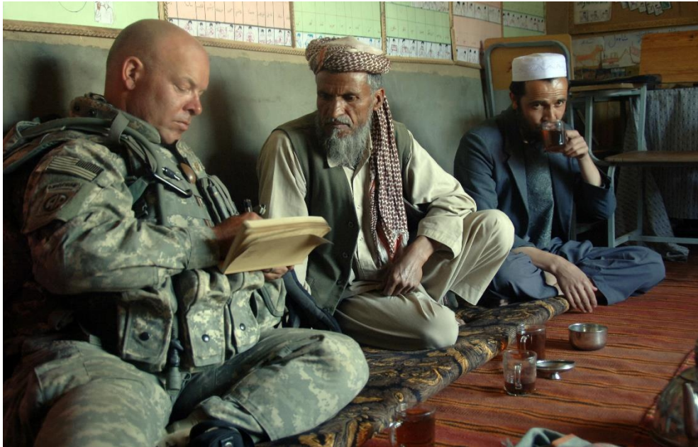
חייל אמריקאי מראיין אזרח אפגני. למידה של התכסית האנושית

מאמצי הלמידה הפכו אותנו ל'טבעיים' יותר במרחב הפעולה. פיתחנו מונחים למפגעי היחיד ולחוליה המקומית, התחלנו לזהות תהליכים ובתוכם גורמים מסייעים ומאפשרים בסביבה הקרובה והרחוקה של הטרור בהשאה. מנגד סימנו מגמות מרסנות ומתנגדות לאלימות ובתוך כל אלו סימנו גורמי השפעה מסוגים שונים המאפשרים פעילות אופרטיבית. בניתוח 'תכסית' אנושית עמדנו על בעיות היסוד האזרחיות והמאפיינים הייחודיים של כל כפר, שכונה או מחנה פליטים שערערו באופן בסיסי את המציאות הביטחונית-אזרחית, אך גם היו 'צא כיוון' חשוב בראיית ניצול הזדמנויות.