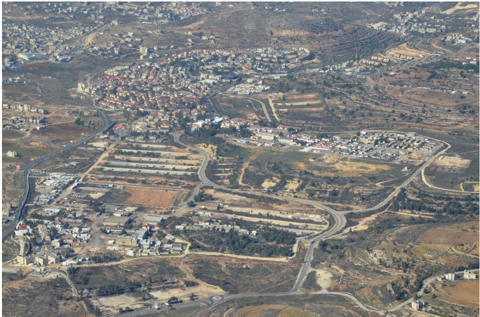
תמונה אווירית של אזור שומרון

הדגשנו את העוצמה הגדולה של תהליך הערכת המצב הנשען על למידה; את החשיבות להגדיר סדרי עדיפויות באמצעות שיעון לחימה משתנה; את משמעות הפיגועים שהתממשו לאחרונה – תופעת ההדבקה גרמה לכך שאחרי פיגוע במרחב מסוים ובמתווה מסוים הסבירות להתממשות פעולה דומה עלתה באופן משמעותי; הגדרת מרחבים מאוימים לפיגועי השראה; הגדרת מרחבים מאוימים בירי; הגדרת מדרג הישובים המאוימים; קביעת מרחבים אלימים ועוד. את כל התהליך הזה בחנו באופן שוטף, למדנו ועדכנו. הבנו שהמפגע בהשראה המייצר אתגר גדול בשורה של תחומים, מייצר גם הזדמנות הנובעת מהגורמים המאפיינים אותו. מפגע בהשראה עושה את הפיגועים מהבטן, ללא תכנון מוקדם, באופן אימפולסיבי, והחשוב ביותר – הוא עושה את הפיגועים "במקומות שבהם עושים פיגועים".