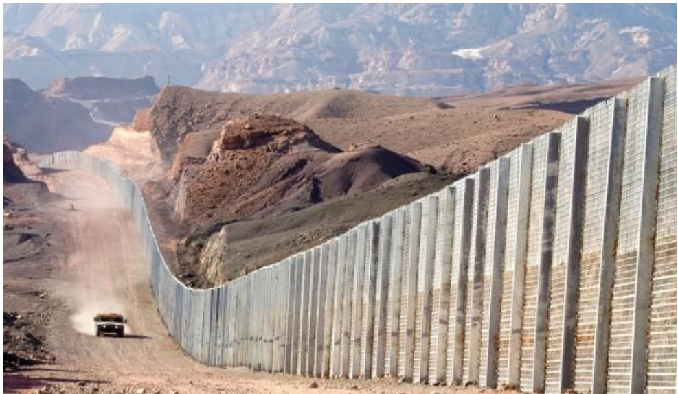
פטרול ליד גדר הגבול בדרום (זיו קורן)

בשנתיים הראשונות לשירותי, טרם מלחמת לבנון הראשונה, נחשב הבטי"ש לרע מגונה. כלומר לפעילות משמימה שיש להמעט בה ככל הניתן, ושהיא מפריעה לצה"ל לעשות את משימתו העיקרית – להתאמן ולהתכונן למלחמה. מעמד הבטי"ש עלה על רקע שנות השהייה הארוכה בלבנון הארוכות וימי האינתיפאדה הראשונה, עת האתגרים גבהו, הלחימה נעשתה שכיחה יותר, והאתגר שניצב בפני הכוחות צמח. גם במציאות מאתגרת זו (מאתגרת יותר בהרבה מהבטי"ש בימינו), עדיין נחשב הבטי"ש משני בחשיבותו עד זזה למלאכת ההתכוננות למלחמה, ומשאבי הזמן חולקו בהתאם – 50 אחוזים לאימונים ו־50 אחוזים לבטי"ש. כדי לשמור על חלוקת זמן זו, גויסו מדי שנה יחידות מילואים רבות, ובלבד שמסכת האימונים וההתכוננות לא תיפגע.