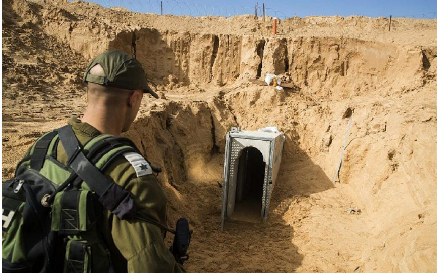
גילוי מנהרה של חמאס באזור עוטף עזה 2016

אופן ההתפתחות של צורת הלחימה האסימטרית משקפת, בקווים כלליים, את רוב מקרי המבחן של היחסים בין הצד האסימטרי החותר לבין הצבא הסדיר. זוהי מערכת יחסים הקשורה בממדים הטקטיים-אופרטיביים. עם זאת במקרה הישראלי האופן שבו התפתחו שני הצדדים זה ביחס לזה לאורך שנים, הביא להתפתחותה של מערכת יחסים משבשת מיוחדת בין חמאס לישראל גם במישור האסטרטגי.