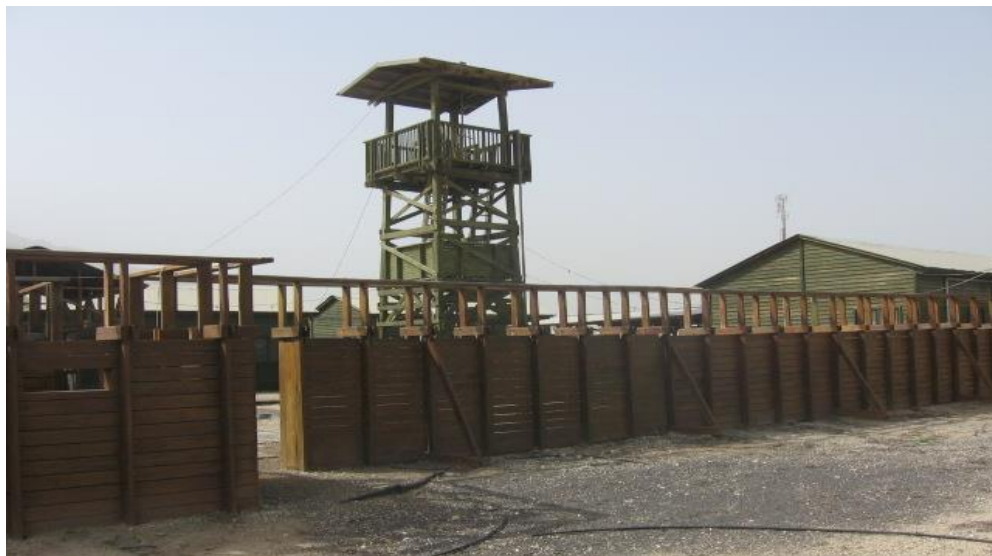
מבנה משוחזר של חומה ומגדל בתל עמל – ניר דוד. תקופה בה יישובי הספר היו חלק מן ההגנה המרחבית (ויקיפדיה)

במאבקים מסוג זה יש לרכיב ההתיישבות האזרחי תפקיד חיוני שאינו יכול להתממש על ידי כוח צבאי. טענה זו מתייחסת למתרחש בכלל קווי העימות, לאו דווקא במרחבי ספר כמו יהודה ושומרון, אלא גם במרחבי הגליל והנגב. כוחות הביטחון כשלעצמם לא רק שהם אינם מספקים מסה של נוכחות רצופה, הם גם אינם רגישים דיים לשינויים המתרחשים בשטח והפוגעים באינטרסים הלאומיים הריבוניים. המאבק שהתקיים בגבול סוריה ישראל לפני 1967, מדגים את דוקטרינת הביטחון הישראלית באופן שבו שולבו האזרחים בספר במאמץ הצבאי. במאבק למימוש הריבונות באזורי מריבה בקרבת הגבול התבקשו החקלאים לעבד את השדות בקרבת הגבול עד המטר האחרון, גם בשטח המפורז, למרות הידיעה שהדבר כרוך בתקריות אש שאף יצאו לעיתים משליטה. האם שילוב האזרחים היה מוצדק במבחן המקצועי הצבאי? האם הוא היה ניתן להנמקה במבחן עלות-תועלת כלכלית? למפקדי צה"ל באותם ימים, רב־אלוף דוד אלעזר שנשא בתפקיד מפקד פיקוד הצפון ולרב־אלוף יצחק רבין, הרמטכ"ל, לא היה ספק בצדקת מאבק זה ובחיוניות שילוב האזרחים החקלאים.