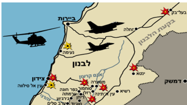
מפת פעולה של מבצע "דין וחשבון" 52

אין פירוש הדבר שפג תוקפה של 'תפיסת דין' בחשיבה הישראלית, אלא שהיא שינתה את צורתה: מבצעי הפעלת הכוח הגדולים בשנות התשעים נגד חיזבאללה בלבנון הראו כי העקרונות הבסיסיים של התפיסה נותרו בעינם, הגם שהיו למבצעים הללו כמה מאפיינים ייחודיים. 50 כמו בעבר היו אלה מבצעים שנועדו להסלמה למטרת מניעת הסלמה. מבצעי האש בלבנון באו כתגובה על הסלמה בלחימה בין חיזבאללה לישראל, והם נועדו להפעיל לחץ כדי למנוע המשך ההסלמה. אולם לא כמו רוב המקרים בעבר, הלחץ היה עקיף שבעקפים: במבצעי "דין וחשבון" ו"ענבי זעם" ב-1993 ו-1996 המטרה הייתה להפסיק את ההסלמה של חיזבאללה, והשיטה הייתה יצירת לחץ על תושבי דרום לבנון שאמורים היו ללחוץ על ממשלת לבנון, כדי שמצידה תפעיל לחץ על סוריה, שנחשבה אז למי ששולטת בחיזבאללה. ואכן, מאות אלפי לבנונים הפכו במכוון פליטים בארצם במהלך "דין וחשבון", וגם ב"ענבי זעם" התרחשה תופעה דומה. 51