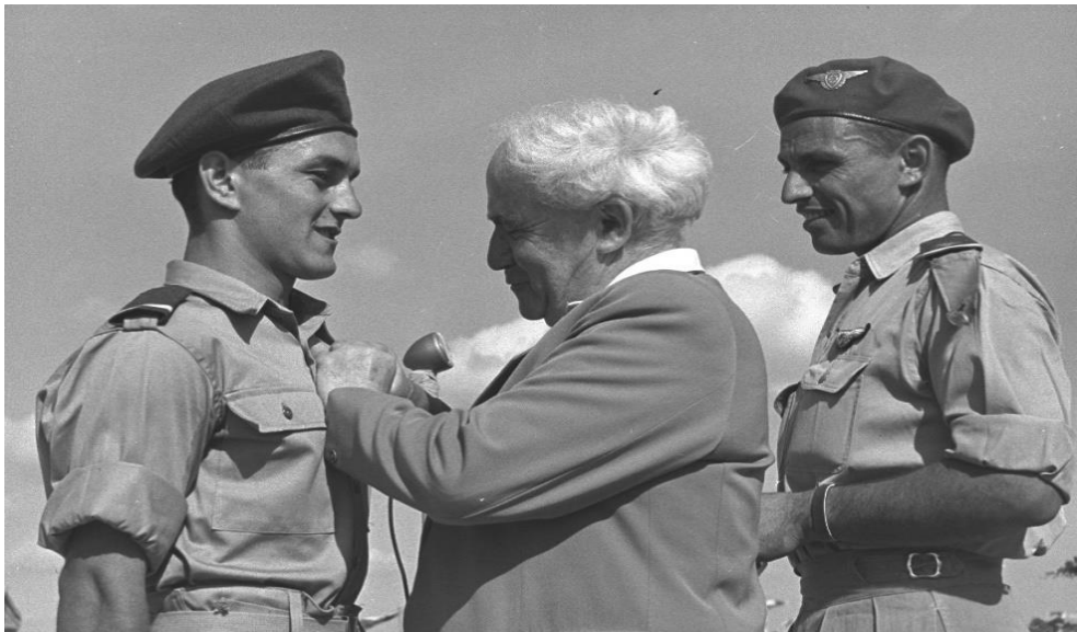
דוד בן-גוריון בטקס הענקת דרגות בחיל האוויר (ויקיפדיה)

מול איום 'יסודי' מיידי – צבא בקנה מידה מלא העלול להיות מעוניין לפלוש – המטרה הישראלית המיידית הייתה בדרך כלל למנוע הסלמה. פעולה צבאית אמורה הייתה לבוא רק כאשר ברור היה כי האויב מחפש הסלמה. 15 אולם מול מחבלים, מסתננים וארגוני טרור ושולחיהם, ביקשה ישראל לא פעם דווקא להסלים את המצב, כדי למנוע הסלמה: אם מחבלים מכים בנו, נכה בהם או בשולחיהם או באחראים עד שהמחיר על המשך פעולותיהם יהיה "יקר" מכדי שכדאי יהיה להם לשלמו.