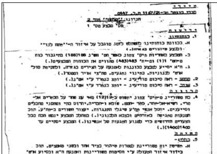
'קלחת מס' 2 – פקודת מבצע מס' 1, 10 בינואר 1970 36

יום לפני הפעולה הוצגה התוכנית בפני הרמטכ"ל. גור הדגיש את חשיבות הפעולה המהירה שנבעה מהמגבלות הפוליטיות והמדיניות הרבות, ואף שם הדגש על איפגיעה בצבא לבנון ובאזרחים. הרמטכ"ל בר לב ציין את שתי המגבלות המרכזיות של המבצע: הראשונה מדינית – לבנון היא מדינת חסות מערבית שמשטרה פרו-מערבי, וארה"ב לוחצת כי נימנע ככל האפשר מפגיעה באזרחים ובאנשי צבא לבנונים. המגבלה השנייה קשורה לראייה רחבה יותר של תופעת הפת"ח. בר לב הדגיש את הצורך בזהירות ובהימנעות מנפגעים ככל האפשר, ובשל כך את חוסר הרצון להתעקש על "יעדים קשים". הוא הנחה לעשות שימוש נרחב יותר באש מאשר בהסתערות: 37