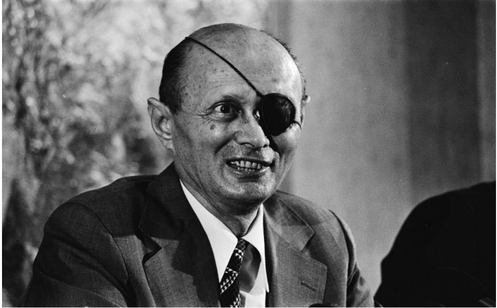
משה דיין בתפקידו כשר ביטחון