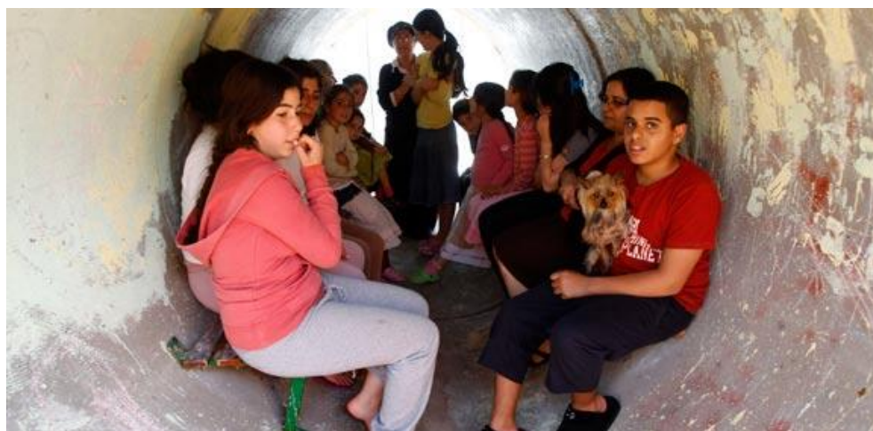
האוכלוסיה הישראלית הסתגלה לשגרת החיים הלא-יציבה

את תושבי תל אביב למקלטים, ובין העובדה שמדובר בגורמים שאין לרצותם ואי אפשר להביסם "אחת ולתמיד" בפעולה צבאית. הצירוף הזה היה מדכא את הציבור בישראל ומאיים על חוסנו, לולא ויתר ממילא על התקווה לפייס את חיזבאללה וחמאס, לולא ידע ישראל מסוגלת להביא בתגובה חורבן על לבנון ולפעול על פי הצורך בסוריה ולפגוע, אם יש בכך צורך, גם באיראן העומדת מאחוריהן. הציבור הזה היה רדוף חרדה מפני פגיעות חמאס, לולא צפה בחורבנה של עזה בשלושה מבצעים גדולים (עם אמפתיה מסוימת כלפי האזרחים האומללים הלכודים בה), לולא בטח ביעילות החומה התת־קרקעית לצמצום איום המנהרות ההתקפיות, ובעיקר לולא נכח בשיתוף הפעולה האסטרטגי בין ישראל למצרים הדוחק את חמאס למבוי סתום. עימותים מכאיבים אומנם צפויים, אך הציבור מניח שמאזן הנזק לישראל מול הסבל לפלסטינים והתועלת ליעדי חמאס נוטה בהתמדה לטובת ישראל.