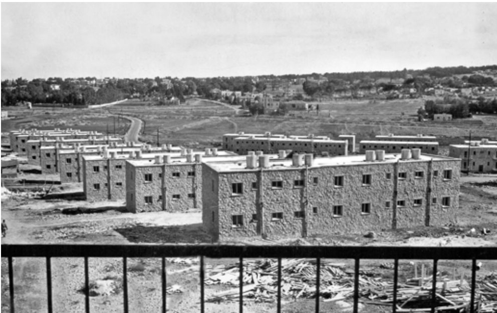
גורמים בצה"ל הזהירו כי האזור חשוף לירי מעבר לגבול ועל כן אין לבנות שם שכונת מגורים. בתי הקטמונים – לימים גוננים – בעת בנייתם, 1964

תושבי השכונה היו חשופים לירי מעבר לגבול, מכיוון הרכס שעליו הוקמה לימים שכונת גילה. גם הקרבה לחלקו הישראלי של הכפר בית צפאפא הטרידה את שלוות התושבים ואת שלוותם של קצינים בכירים בחטיבה 16. למרות שהקמת השכונה קיבלה את ברכתו של ענף ההתיישבות במטכ"ל, ואחרי שבנייתה כבר הייתה בשלב מתקדם, התנגדו לפתע קצינים